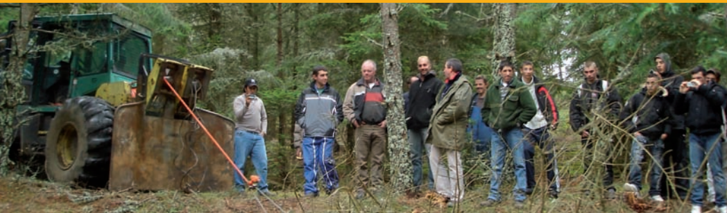
Réunion forestière avec des professionnels (ici sur l'utilisation du câble synthétique en débardage)